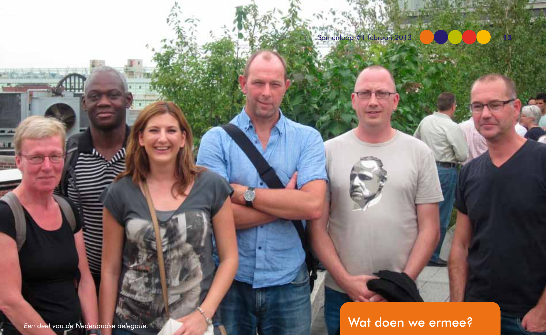
Een deel van de Nederlandse delegatie.

dat niet iedereen zijn huiswerk heeft gemaakt, volgt er geen 'preek' over verantwoordelijkheid nemen. Hij vraagt zijn studenten erover na te denken wat er is gebeurd waardoor ze hier niet aan toe gekomen zijn. Zonder dit te forceren wordt aangezet tot het leggen van een link naar andere situaties. 'Wat maakt dat je iets wel of niet doet in je leven.' Iedereen krijgt aandacht en hij roept bij alles "cool en bedankt dat je zo authentiek bent!" Het is de samenhang van al die dingen waardoor het werkt. Door deze sfeer durven alle studenten een inbreng te geven.